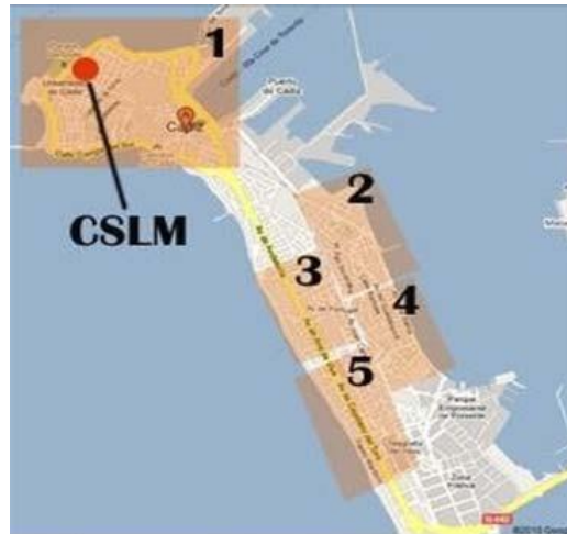
1. Zona Centro, 2. Zona Corte Inglés, 3 Zona Avenida Principal, 4. Zona Avenida Secundaria 5. Zona Playa