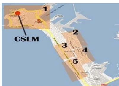
1. Zona Centro, 2. Zona Corte Inglés, 3. Zona Avenida Principal, 4. Zona Avenida Secundaria 5. Zona Playa